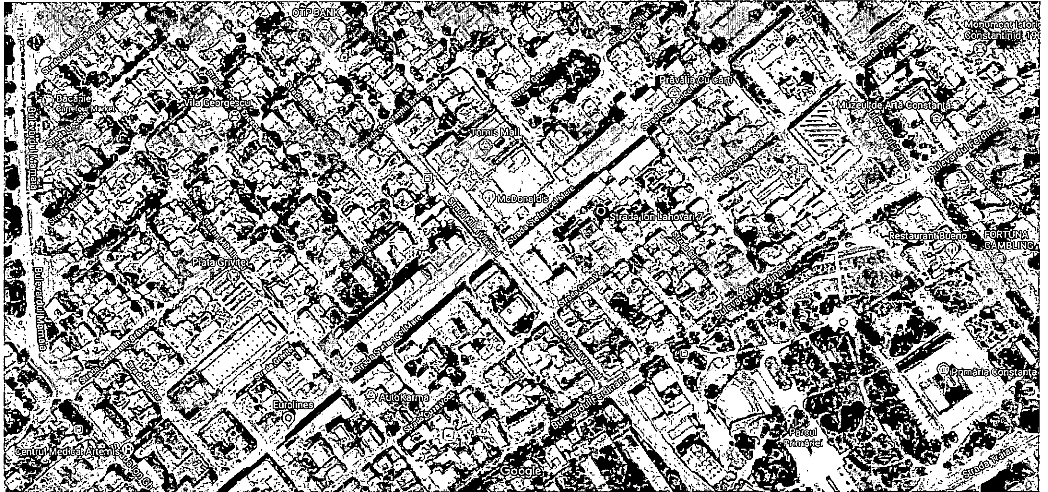
50 m